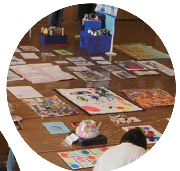
第17回 びゅああ〜と展 審査会場風景